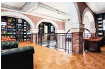
HOTEL NOT HOTEL

★★★ Citiez Hotel Amsterdam Osdorpplein 372A, tel. 0031-(0)20-2246280; www.citiezhotelamsterdam.com Per i cittadini del mondo che amano viaggiare, un hotel di tendenza con 71 camere nel sobborgo di Osdorp. Doppia con colazione da 91,10 euro.