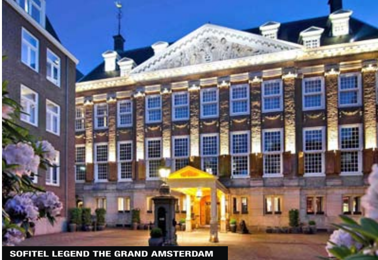
SOFITEL LEGEND THE GRAND AMSTERDAM