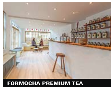
FORMOCHA PREMIUM TEA

Formocha Premium Tea Eerste Looiersdwarsstraat 28, tel. 0031-(0)20-7522832; www.formocha.nl Orario: lun. 13-18, mar.-sab. 11-18 Negozio-tea room dove assaggiare e acquistare tè. A partire da 5 euro. ▶▶